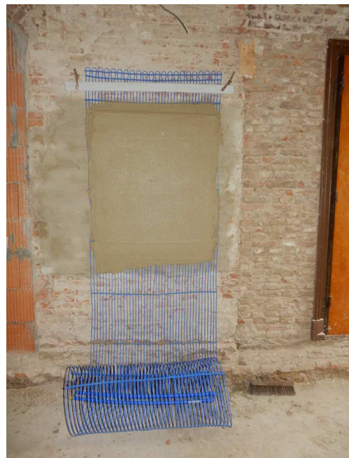
Proefvlak aanbrengen klimaatmatten